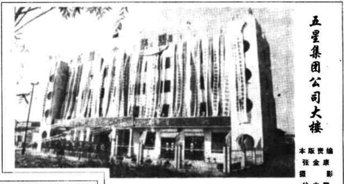
五星集团公司大楼

成绩属于过去，未来任重道远。我们决心在今后的五年里实施我们的511工程，即五年后的今天，产值达1亿元，利税过千万元。 我们五星人说话是算数的，五年的创业历史已经证明了这一点。我们决心在市委、市政府的正确领导下，团结奋斗，以大跨度、跳跃式、超常规的步伐，为实现自己的宏伟目标勇往直前，为振兴东营做出贡献！