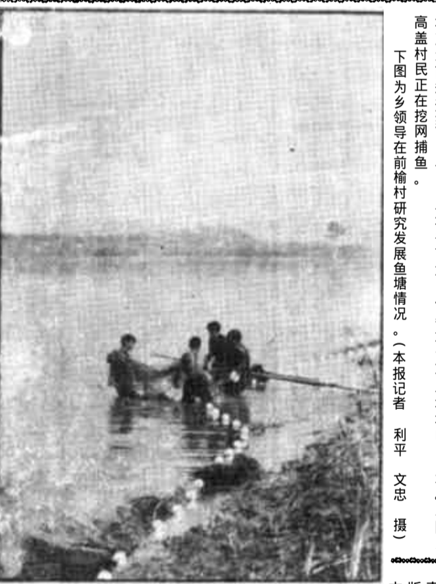
高盖村正在挖网捕鱼。下图为乡领导在前村研究发展鱼塘情况。

本报讯 9月20日，全市消化外贸挂亏工作会议召开。会上传达了贯彻了全省消化外贸挂亏会议精神。副市长滕化迎参加会议并讲了话。